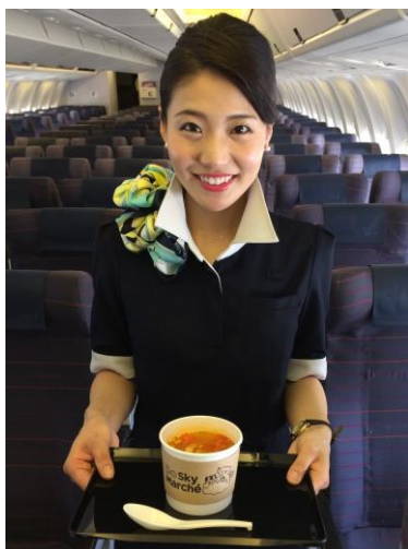
「北海道産たまねぎのスープリゾット」